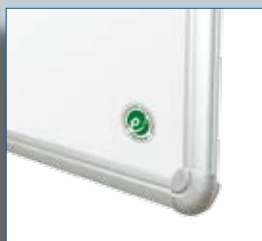
Détail profil gamme SB