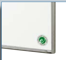
Détail profil gamme FS