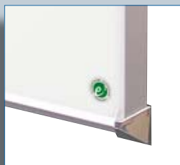
Détail profil gamme INKA